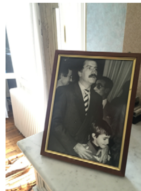
Mairie de Bègles, juin 2017